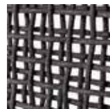
intreccio . weave CHECKED